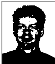
Candidat télévendeur après transformations binaires

Notre premier candidat télévendeur ne subira au départ que des transformations binaires sur les teintes de sa tenue vestimentaire pour la différencier avec celle du candidat avec surcharge pondérale. Il s'agit de notre premier candidat télévendeur sans surcharge pondérale.