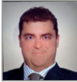
Candidat commercial N°2 après transformation informatique

Notre premier candidat télévendeur ne subira au départ que des transformations binaires sur les teintes de sa tenue vestimentaire pour la différencier avec celle du candidat avec surcharge pondérale. Il s'agit de notre premier candidat télévendeur sans surcharge pondérale.