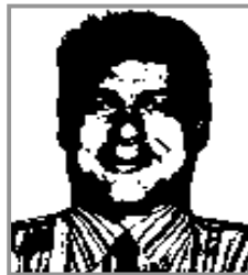
Candidat télévendeur Caractéristique : surcharge pondérale

On obtient après transformation la photo suivante :