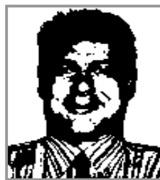
Candidat télévendeur Caractéristique : surcharge pondérale

On obtient après transformation la photo suivante :